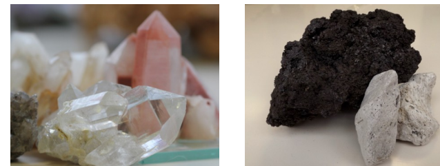
Figura: quarzo ialino e quarzo rosa; lava e pomici del Vesuvio