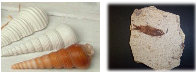
Figura: calchi fossili e il fossile del pesce Knightia

Il laboratorio prevede una parte di osservazione di fossili con il supporto di schede descrittive e la compilazione di una scheda individuale per ogni campione fossile e la realizzazione del calco di un fondale marino con argilla e gesso.